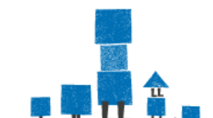
YHDEN VANHEMMAN PERHEET