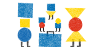
KAHDEN KULTTUURIN PERHEET