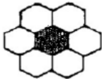
1 musta laatta

Mustista ja valkoisista laatoista rakennetaan laatoitus suoraan riviin: